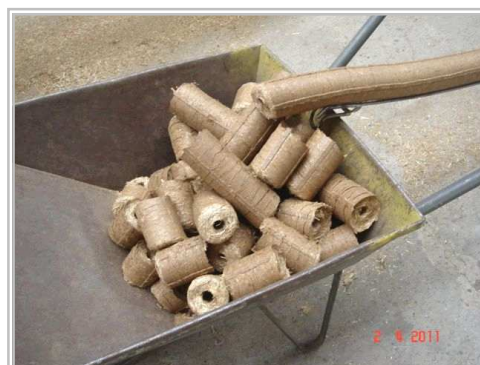
Брикеты из танзанийской травы и рисовой шелухи

Фотография с левой стороны: польское слово "Z ŁUSKA" обозначает „С РИСОВОЙ ШЕЛУХОЙ”