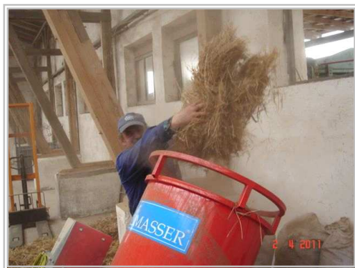
Ручная загрузка измельчителя