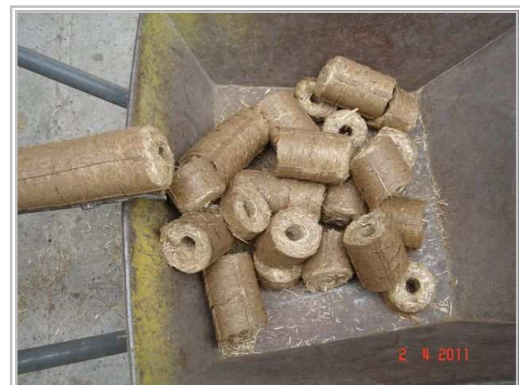
Брикет из танзанийской травы