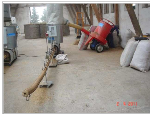
BIOMASSER® SOLO-SET использованный в тестах