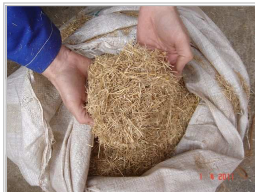
Сечка танзанийской травы