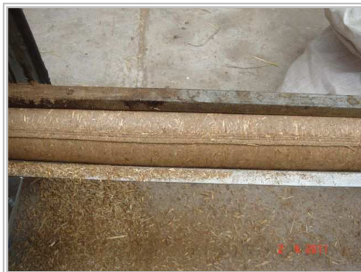
Брикет из танзанийской травы в дугообразном проводнике брикетировочного пресса BIOMASSER®