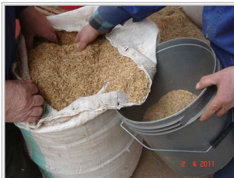
Насыпание рисовой шелухи в ведёрко

Мы предлагаем добавить 20 дм 3 рисовой шелухи в течение одного часа непрерывного брикетирования.